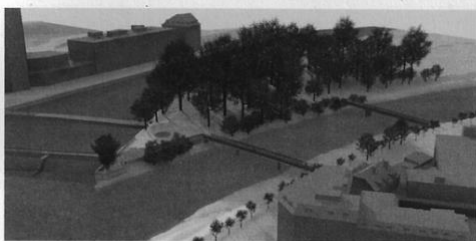
Die neue Zufahrtsbrücke vom Sihlquai zum Platzspitz (Vordergrund in der Bildmitte), rechts davon der flussaufwärts verschobene Mattensteg.

Der Damm soll unterhalb der Treppe weiterhin begrünt sein.