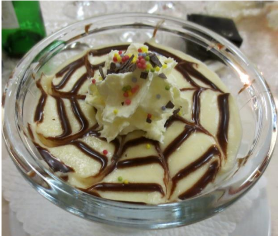
Birnencreme mit Rahm

Zeit für eine Erfrischung und einen kühlen Kopf!