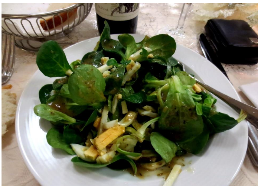
Nüsslisalat mit Ei und Hausdressing