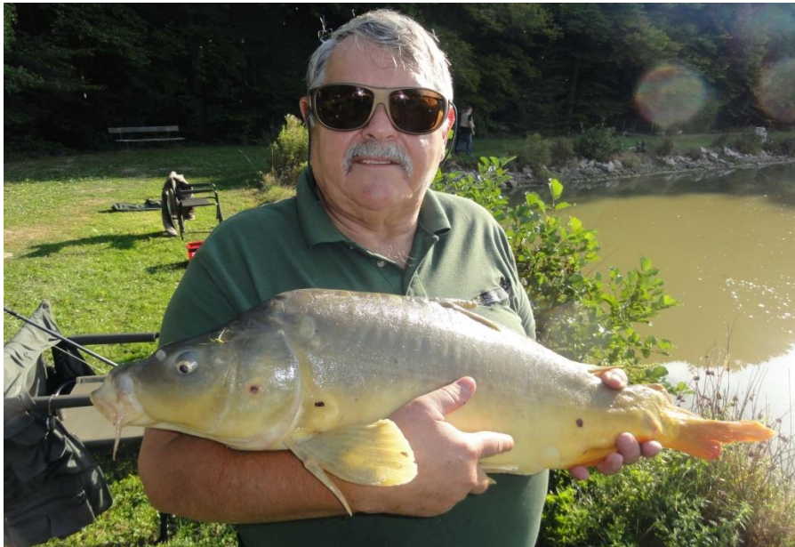
Erinnerungsbild Karpfenfischen 2015

Die Kanne wurde somit von unseren Basler Freunden „zurückerobert“. Wer weiss, welchen Köder dann die Karpfen das nächste Jahr einschlürfen werden.