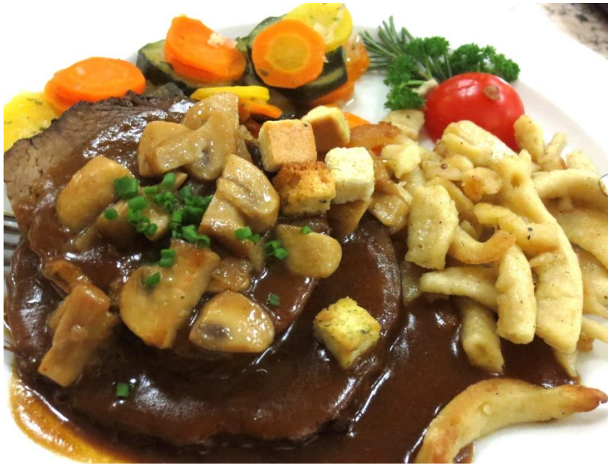
Gespickter Rindsschmorbraten à la Hirschen, Spätzli, Rüebli und Zucchettigemüse